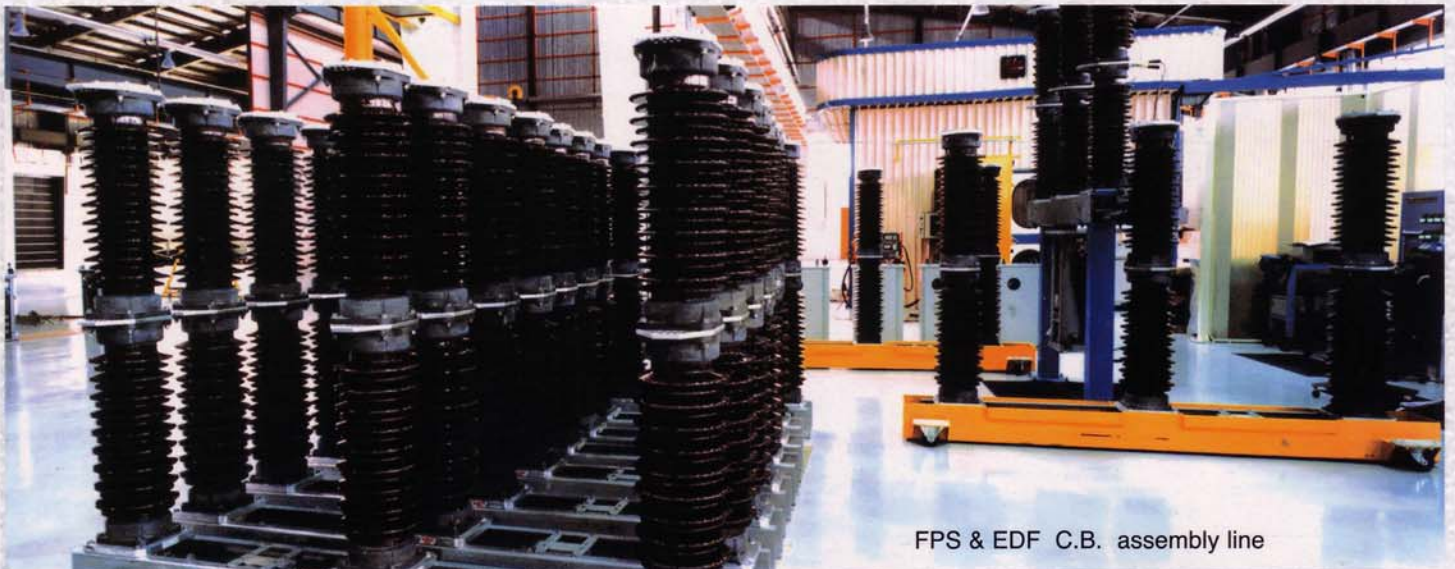
FPS & EDF C.B. assembly line