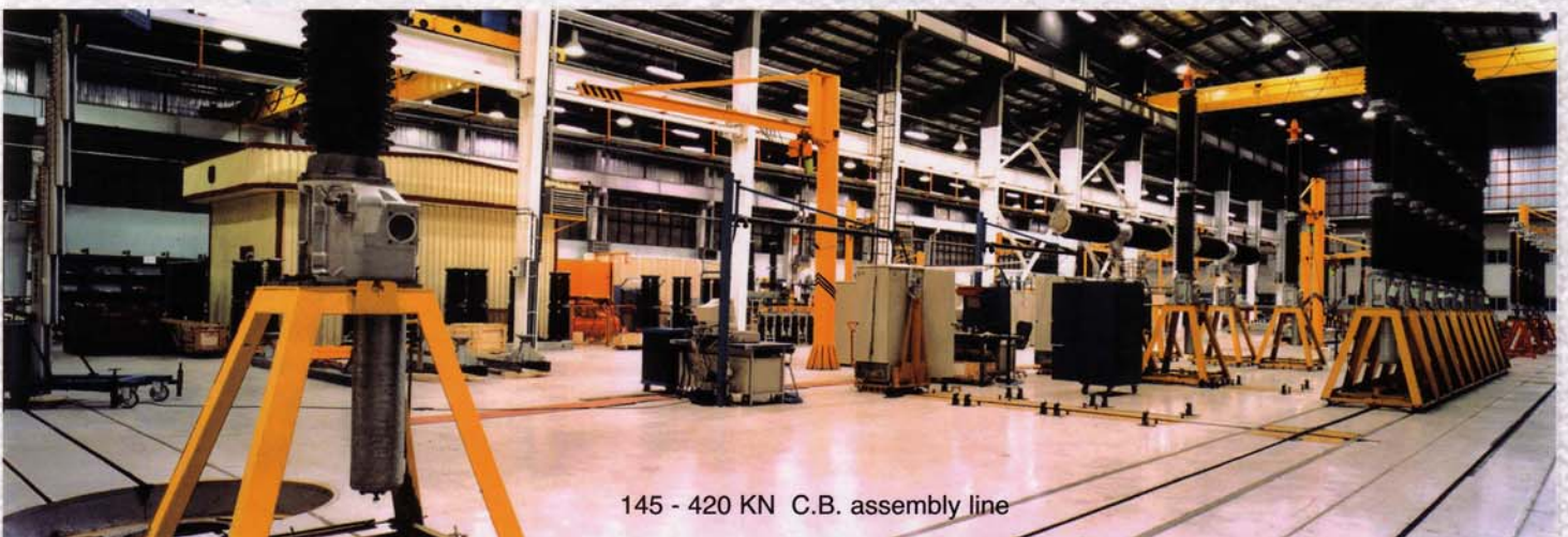
145 - 420 KN C.B. assembly line