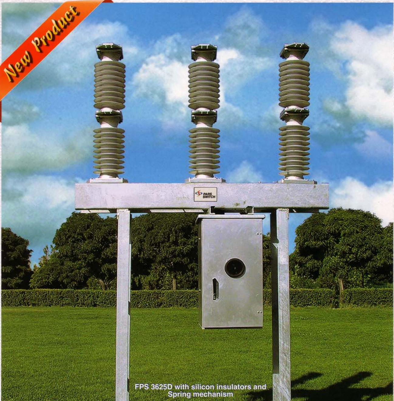
FPS 3625D with silicon insulators and Spring mechanism

Rated Voltage : 24 - 36 KV Rated Current : 630 - 1600 A Rated Breaking Current : 16 - 25 KA