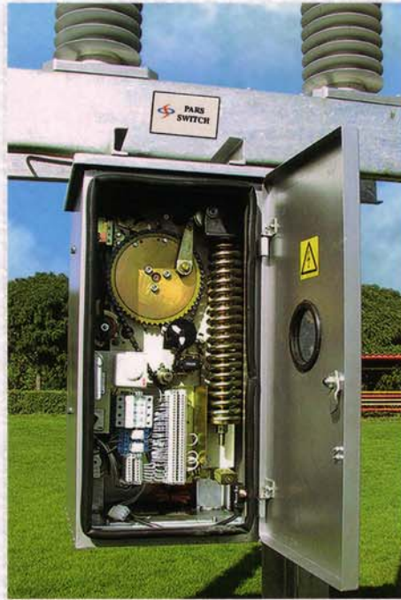
Internal view of FPS op. mechanism